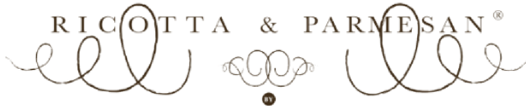
TAVOLA DI PASTA